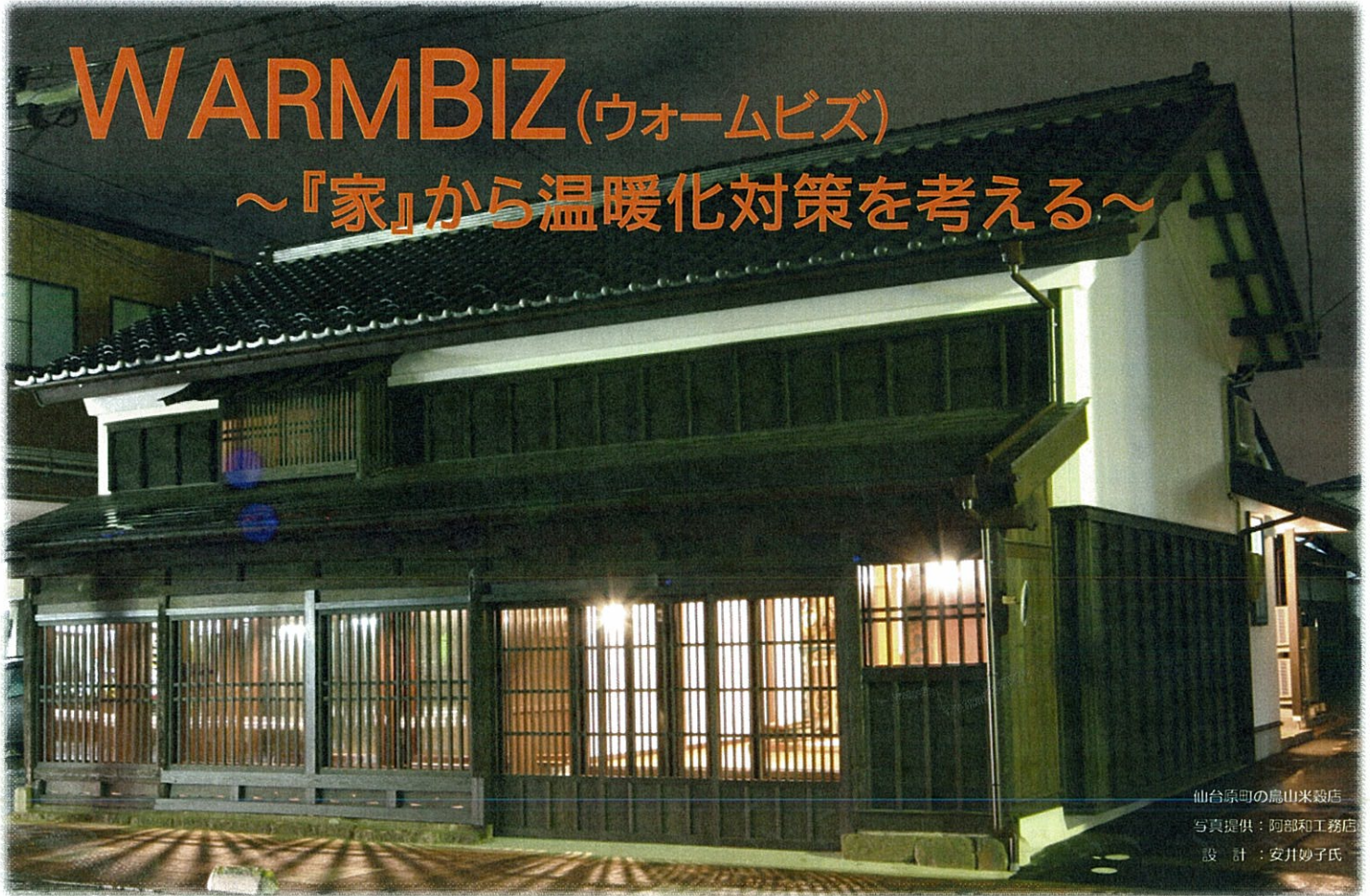
仙台原町の鳥山米穀店 設計：安井妙子氏