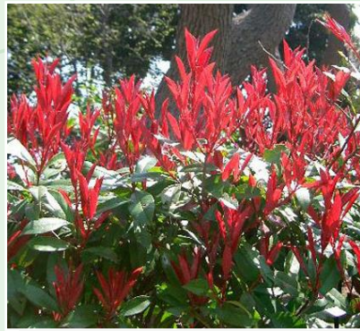
レッドロビンの挿し木をします