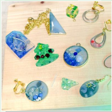
ピアス等アクセサリー (例) ↑いずれか1個作ります↑