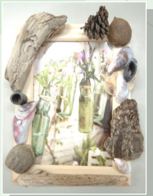
フォトフレーム (例) ↑いずれか1個作ります↑