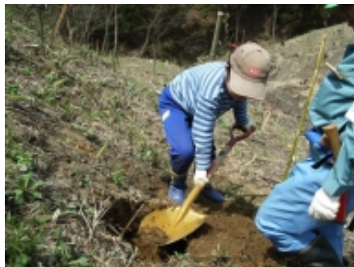
大きなスコップに負けずにがんばりました。