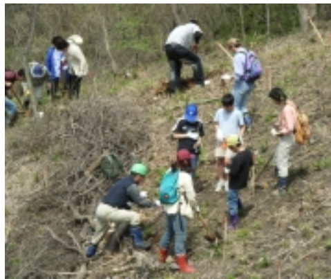
森林インストラクターの方に指導していただきながら、参加者全員で植えました。

四季の森は、火災により広葉樹林を焼失しています。ここを復元しようと、周りにある木と同じ樹種、コナラ 100本・クヌギ 150本・クリ 50本の計 300本を植えました。