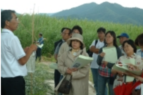
スタディツアーの様子