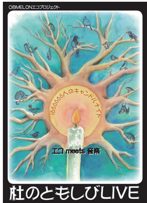
今回のポストカードも好評でした

※ 1000000人のキャンドルナイトとは『夏至と冬至の夜、8時から10時までの2時間だけみんなでいっせいに電気を消しましょう。』この呼びかけに応えた人が、ひとり、またひとり、と増えていくことでゆっくと広がってきた、自主参加のムーブメントです。