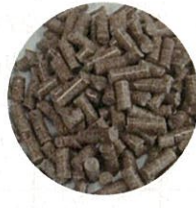
↑ 木質バイオマス燃料となる薪(左)と木質ペレット(右)