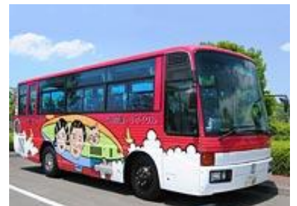
ワケル君バスで移動します。

トレーや容器包装プラスチックの再生工場です。家庭から出たプラごみを原料にリサイクルパレットの製造をしています。